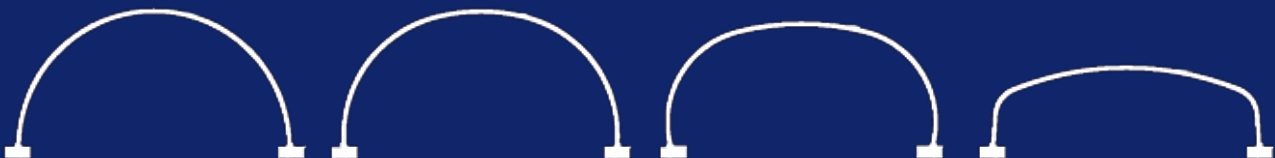
Normaali kaari SC...SA